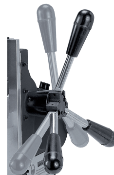
Přepínač pomocí kliky autoposuv / ruční posuv